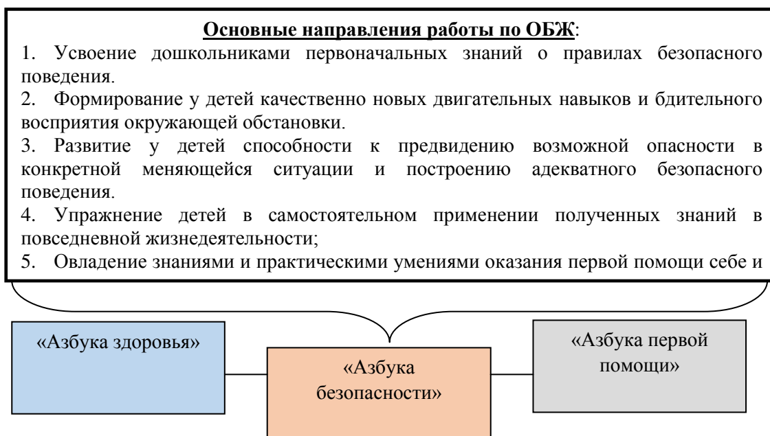
Рисунок 1 – Модель реализации направления «Формирование у детей основ безопасного поведения в быту, социуме, природе»

Проблема безопасности жизнедеятельности человека представляет серьезную проблему современности. Ребенок дошкольного возраста по своим физиологическим особенностям не может самостоятельно определить возможные опасности своего существования и сориентироваться в мерах их устранения. Поэтому формирование основ безопасности у дошкольников является актуальной педагогической задачей и на взрослого человека возложена важная миссия защиты ребёнка – дать элементарные знания основ безопасности в доступных, адекватных формах организации детской деятельности (Рисунок 1,2)