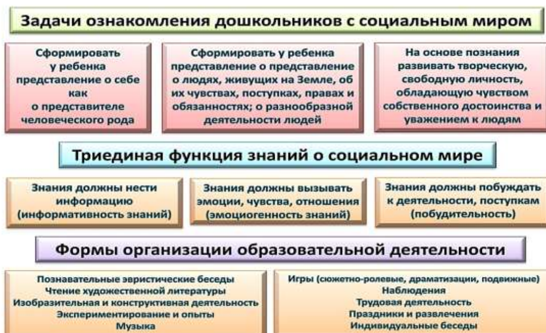
Рисунок 4 – Задачи ознакомления дошкольников с социальным миром