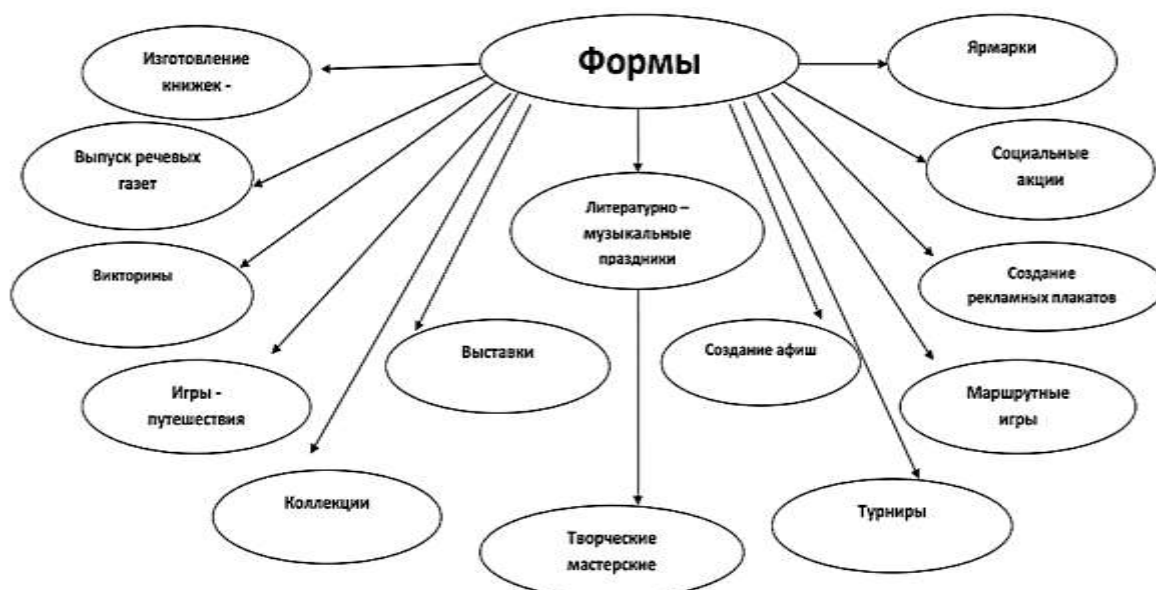
Рисунок 6 – Формы работы с детьми по формированию коммуникативных навыков

При организации образовательного процесса Программы обеспечивается комплексный подход в решении задач речевого развития с использованием различных средств, форм, методов, приемов, адекватных возрасту с учетом основополагающих принципов, приоритетных при реализации данной области.