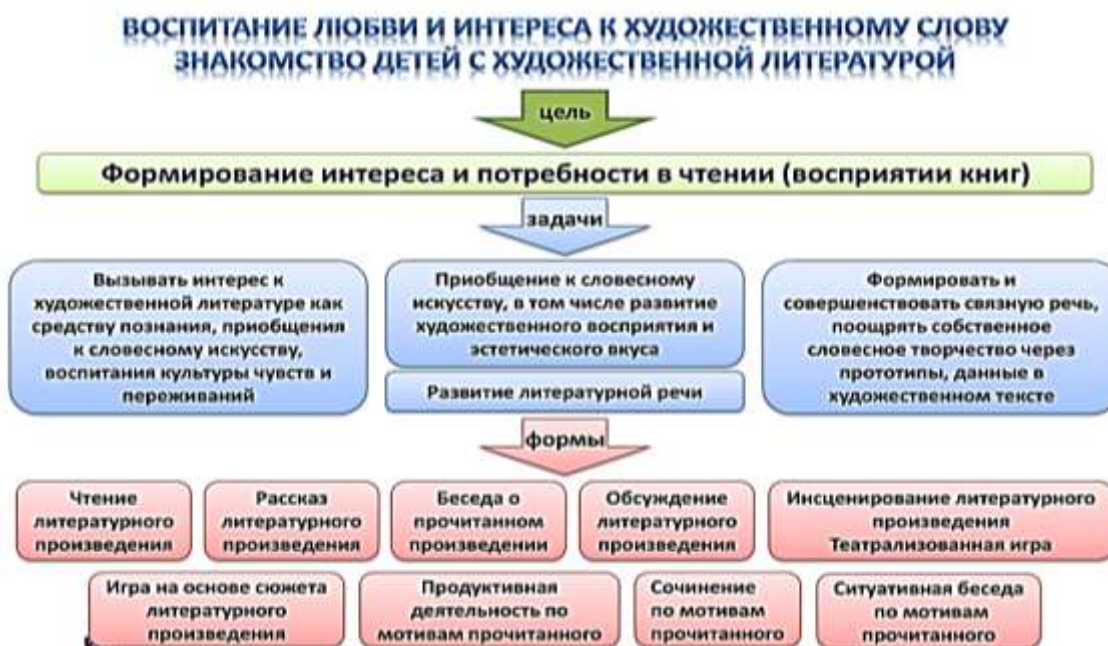
Рисунок 7 – Воспитание любви и интереса к художественному слову, знакомство детей с художественной литературой