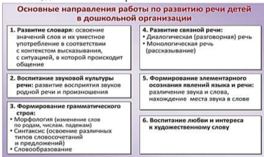
Рисунок 5 – Основные направления работы по развитию речи в дошкольной организации

Современные образовательные технологии: информационно – коммуникативные, здоровьесберегающие, исследовательской деятельности, лично – ориентированного взаимодействия, проектной деятельности стимулируют самостоятельную коммуникативную деятельность дошкольников, дают возможность реализовать свои способности.